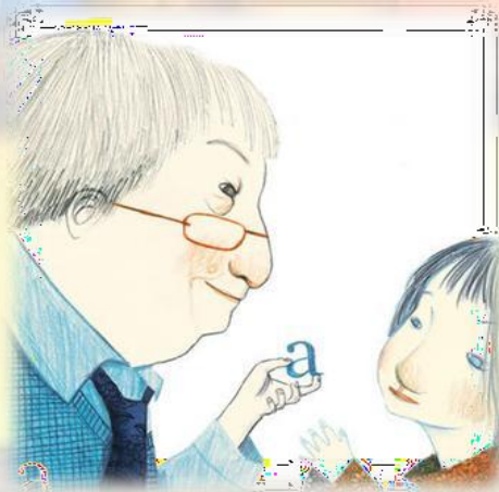
Ilustración: Esther Gómez Madrid

Los cuentos narrados en la sesión son adaptaciones de historias escritas por Gloria Fuertes, o adaptaciones propias a partir de poemas, frases o textos de la misma autora. Estas creaciones han sido producto de un riguroso estudio, selección y organización del amplio material de la escritora. Hay textos narrados íntegramente, hay varios textos que se han juntado en un único relato y finalmente hay textos dependiendo de las edades del público.